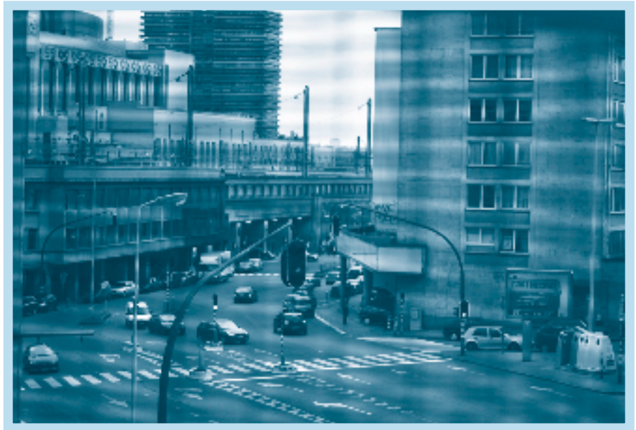
Het heeft weinig zin om sjieke stukjes verbinding aan te leggen als honderd meter verder dit soort voetgangersnachtmerrie ligt waar niemand iets te zoeken heeft. Alleen globale projecten brengen zoden aan de dijk.

Ten eerste moeten de verbindingen verbeteren. De heraanleg van de Brabanttunnel is maar een eerste aanzet. "Is er bijvoorbeeld ooit een globaal plan gemaakt van bewegingsstromen tussen – zeg maar – de Adolphe Max en de Brabantwijk?" vraagt ze. "Zoiets was belangrijk geweest. Bovendien moet je in de keten van voetgangersverbindingen elke cruciale schakel