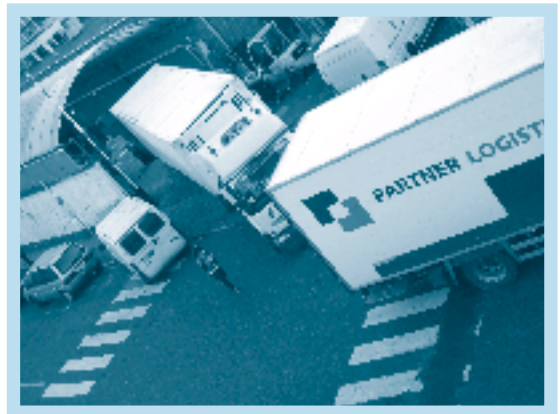
De shopping van Woluwe brengt de voetgangers nu al in nauwe schoentjes en het dreigt nog te verergeren.

verkeersdrukte van de Woluwelaan naar die kleinere straat en dreigt daar de totale blokkade. Nu al parkeren vrachtwagens zich op drukke dagen in dubbele file of op voetpaden. Om af te sluiten noteert het wijkcomité een flagrante schending van het Gewestelijk Bestemmingplan. Deze laat maar een uitbreiding toe met 1/5 van de bestaande oppervlakte terwijl het comité een uitbreiding van 1/3 telt. Een vaststelling die ook de gemeente Sint-Lambrechts-Woluwe met verstomming sloeg.