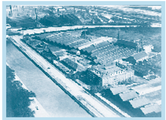
Godin : een luchtfoto van het beschermde woongebouw met daarachter de bedreigde fabriekshallen.

Ten eerste houden de promotoren enkel rekening met de auto. Investerings in veilige voetgangersverbindingen zijn onbestaande. Nochtans heeft Woluwe Shopping nog een openstaande rekening. Ze hebben de stedenbouwkundige lasten van een vorige uitbreiding tien jaar geleden nog steeds niet gebruikt voor een verbetering van het openbaar domein. Het comité protesteert ook omdat vrachtwagens door de kleine Sint-Lambertusstraat moeten om het nieuwe leveringspunt te bereiken. Zo verschuift de