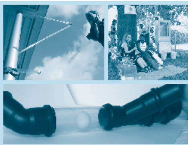
Het pingpong-project spalkt een Londense breuk tussen twee wijken met een ongelooflijk buizensysteem. Mensen kunnen langs die buizen hun boodschappjes doorsturen naar de overkant.

Jaarabonnement : € 10 te storten op rekening 001-2154937-61 van Bral vzw - 1000 BRUSSEL copyright © : overname van artikels aanbevolen mits bronvermelding