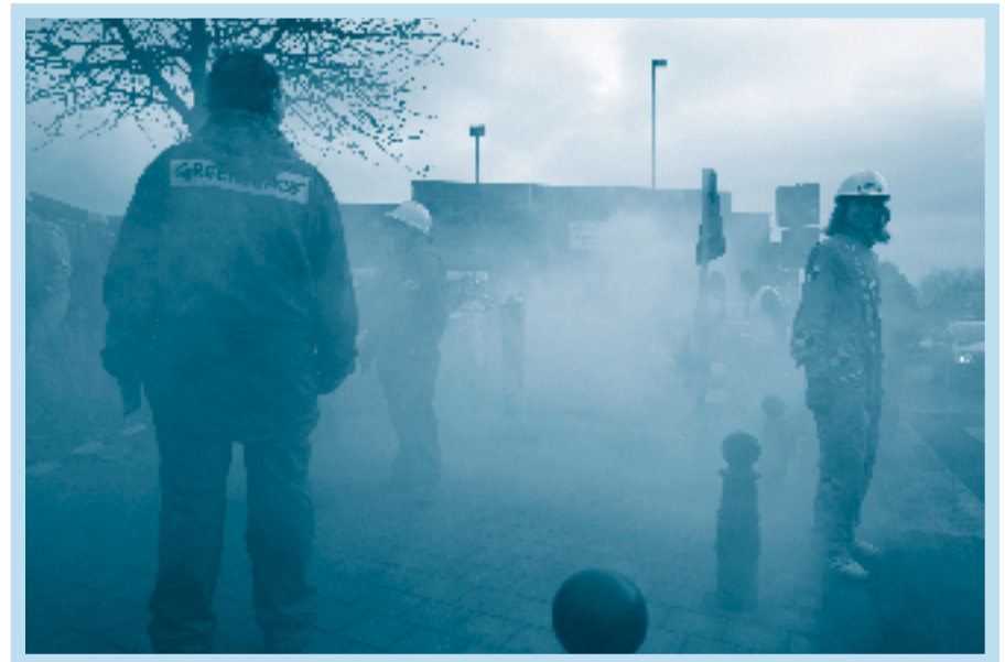
"Meer wegen is een straatje zonder einde." Met die slogan voerde de milieubeweging actie aan het autosalon tegen al die nieuwe betonprojecten in dit land. Je vindt foto's, video en perstekst op www.bralvzw.be.

De Kwb kijkt breder. Op zaterdag 28 februari organiseert ze een wandeling aan