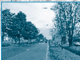
De Leopold III laan: één van die missing links. Wij willen een fietsbrug!

De plannen voor een fietssnelweg tussen Brussel en Leuven zijn al bijzonder concreet. Nu nog de missing links wegwerken.