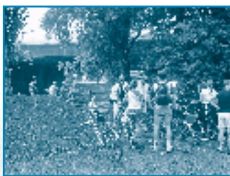
Gestrande fietsers aan de Van Praetbrug. Een onderdoorgang is essentieel wil men een echte fietssnelweg langs het kanaal creëren.