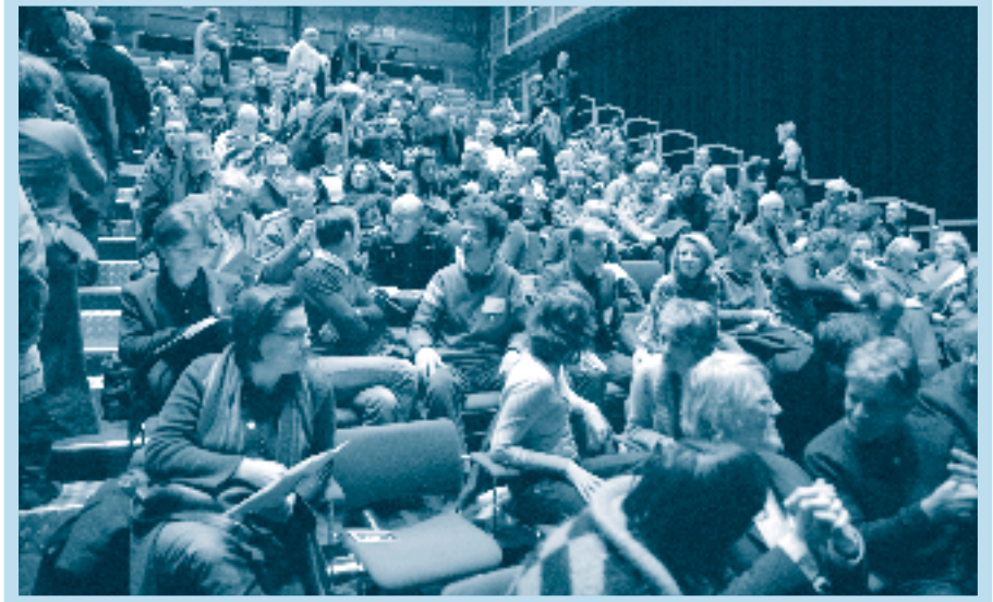
De Staten-Generaal: generale repetitie voor het Grote Openbare Onderzoek?