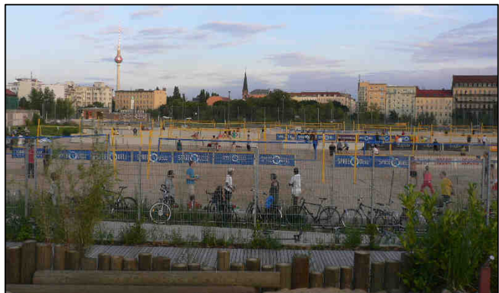
Tijdelijk gebruik van een braakliggend terrein in Berlijn