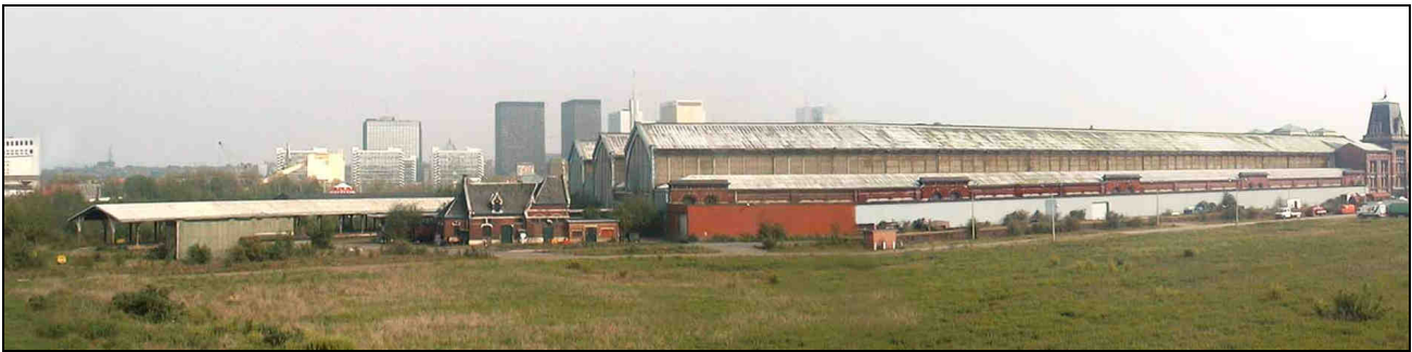
Zicht op T&T vanaf het Lakenveld

We vragen niet onmiddellijk en zeker niet onnodig te bouwen . Eerst en vooral moet men werk maken van het herstel en herwaardering van het landschap en de linken met de omliggende wijken. Vervolgens moeten men de bestaande gebouwen valoriseren. Pas na een evaluatie van de noden kan er eventueel bijgebouwd worden.