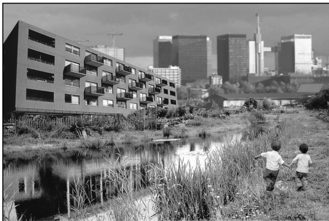
T&T als duurzame stad : met energiearme gebouwen, waterzuiverende parken etc.