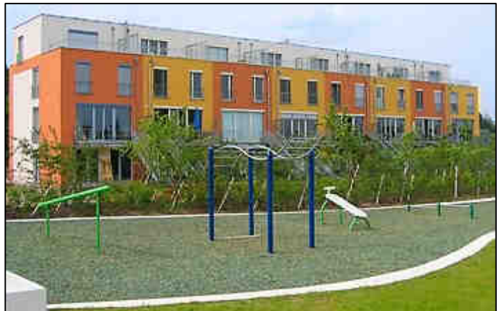
Nieuwe wooneenheden in Berlijn

We moeten beschermen wat momenteel in gevaar is in Brussel; betaalbare huisvesting bijvoorbeeld. T&T is één van de laatste grondreserves van Brussel en ligt bovendien vlak bij het centrum. Het kan perfect beantwoorden aan de nood aan betaalbare woningen (ook voor kleine inkomens). Hierom pleiten wij voor een meerderheid publieke woningen (sociale huisvestingsmaatschappijen, woningfonds, gemeentelijke regie, ocmw, gomb, ...) waarvan een groot percentage woningen van sociale aard .