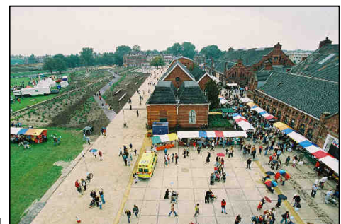
De openbare ruimte in Amsterdam, Westergasfabriek

In deze publieke ruimte is er een groot, aaneengesloten en multifunctioneel park nodig. Meerdere studies toonden het reeds aan: de bewoningsdensiteit in de omliggende buurten is van de